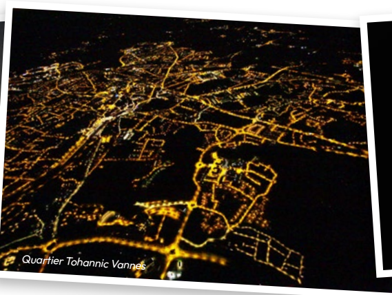
Quartier Tohannic Vannes