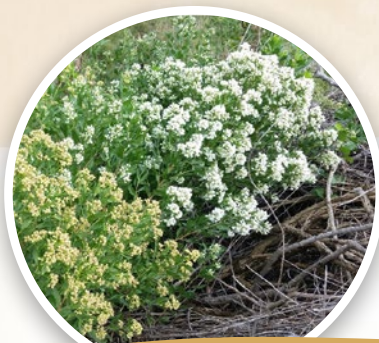
Séneçon en arbre ( Baccharis halimifolia )

Après la destruction des habitats, quelle est la seconde cause d'extinction des espèces sur Terre ? Surprise ! Ce sont les espèces exotiques envahissantes (EEE). Il s'agit d'espèces végétales qui ont été introduites, volontairement ou non, hors de leur territoire d'origine. Certaines ont la particularité de se disséminer très rapidement et d'être résistantes. En éliminant les espèces en présence, elles provoquent une perte considérable de biodiversité et peuvent engendrer des impacts économiques et sanitaires notables. Ouvrez l'œil !