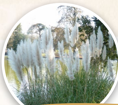
Herbe de la pampa ( Cortaderia selloana )

Comment l'éradiquer : Ses racines profondes nécessitent parfois l'utilisation d'outils spécifiques comme le baccharache, voire le cheval de trait. Arracher avant floraison, laisser le bois sécher puis envoyer en déchetterie ou en centre d'incinération