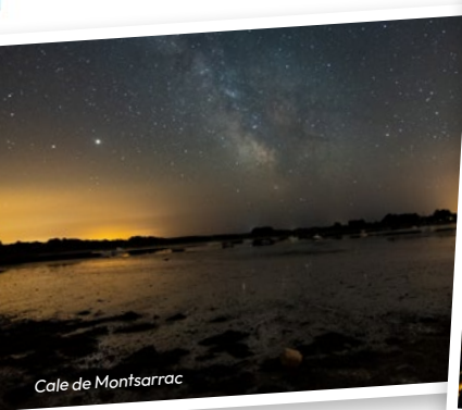
Cale de Montsarrac

ou les équipements collectifs. L'eau n'est pas un bien marchand comme les autres mais un bien commun qu'il faut respecter et apprendre à partager équitablement entre tous les usages légitimes ».