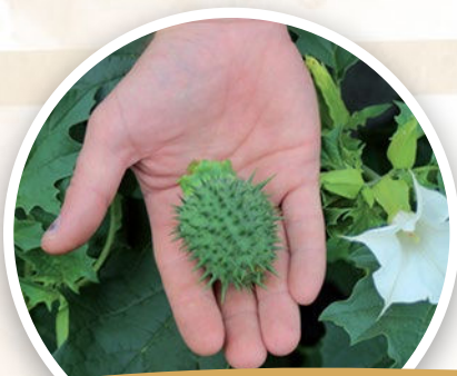
Stramoine commune ou Datura* ( Datura stramonium )

Comment l'éradiquer : Arracher les petits pieds à la pelle. Couper la plante à ras avant l'été et bâcher pendant 2 ans. A défaut, couper les tiges avant la formation de plumeaux contenant les graines. Mettre en big bag et se rapprocher de centres d'incinération