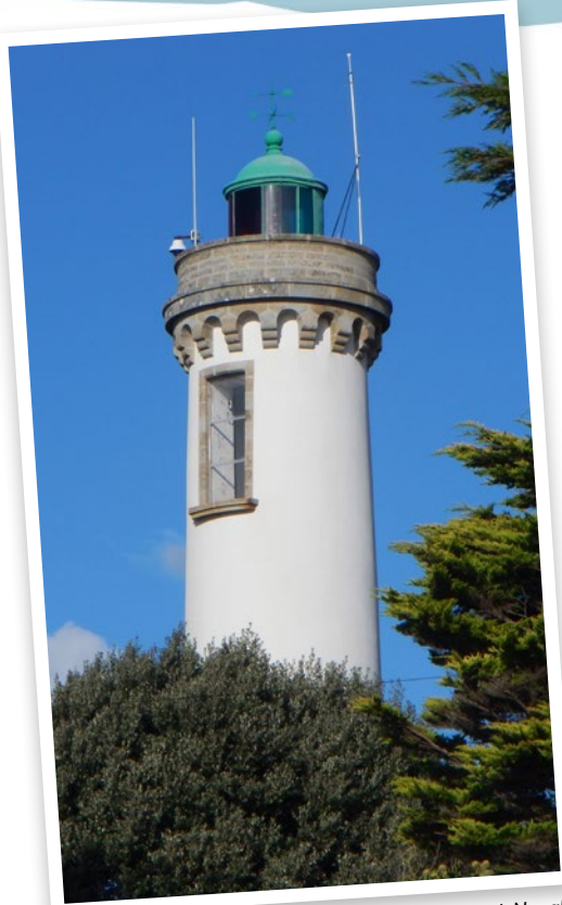
Phare de Port-Navalo