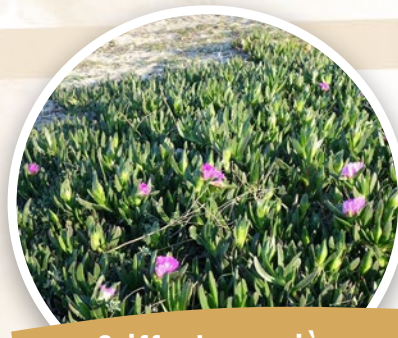
Griffes de sorcière ( Carpobrotus edulis )

Comment l'éradiquer : Arracher la plante avec des gants avant la formation des graines, et la laisser se dessécher sur place. Ne pas la mettre au compost, en déchetterie et surtout ne pas brûler (fumées très toxiques)