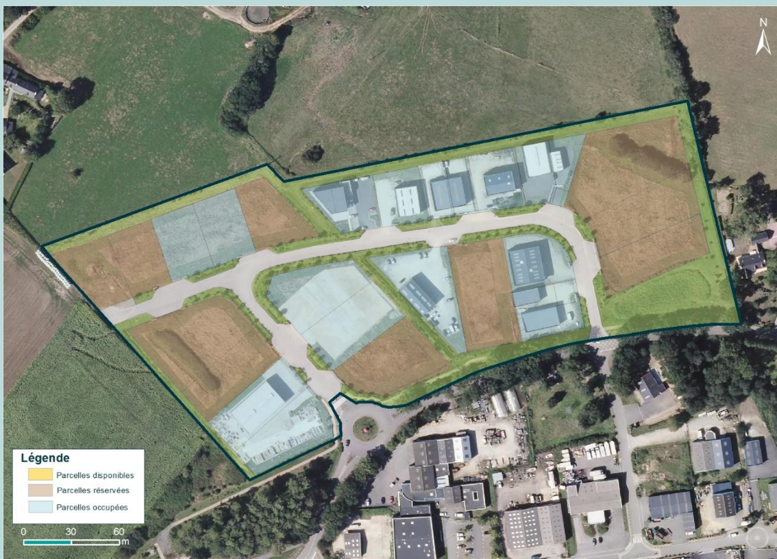
Document non contractuel – MAJ : août 2022